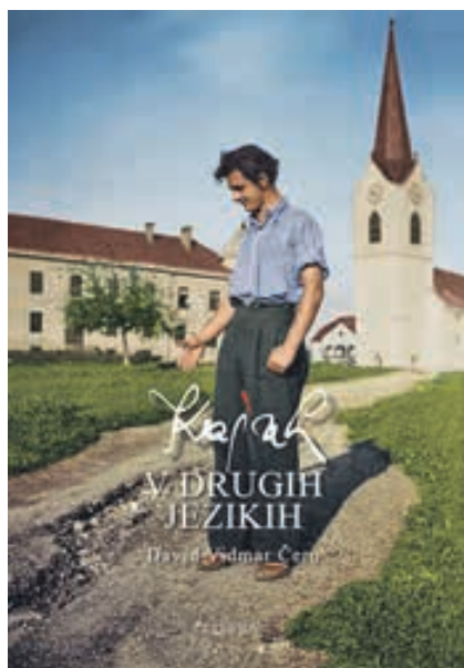
KAJUH V drugih jezikih, avtor David Vidmar Čeruar