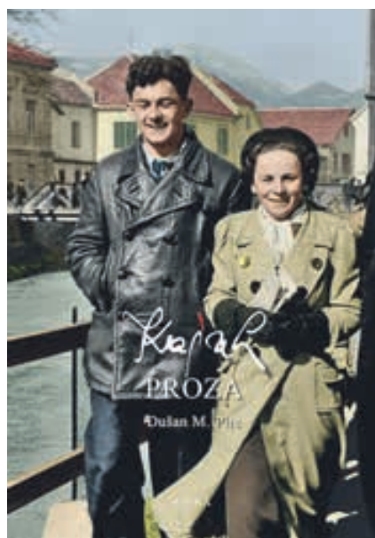
KAJUH Proza, avtor Dušan Pirc