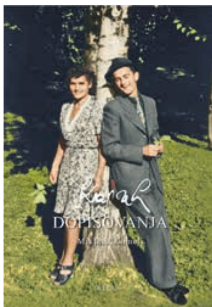
KAJUH Dopisovanja avtor Miklavž Komelj.